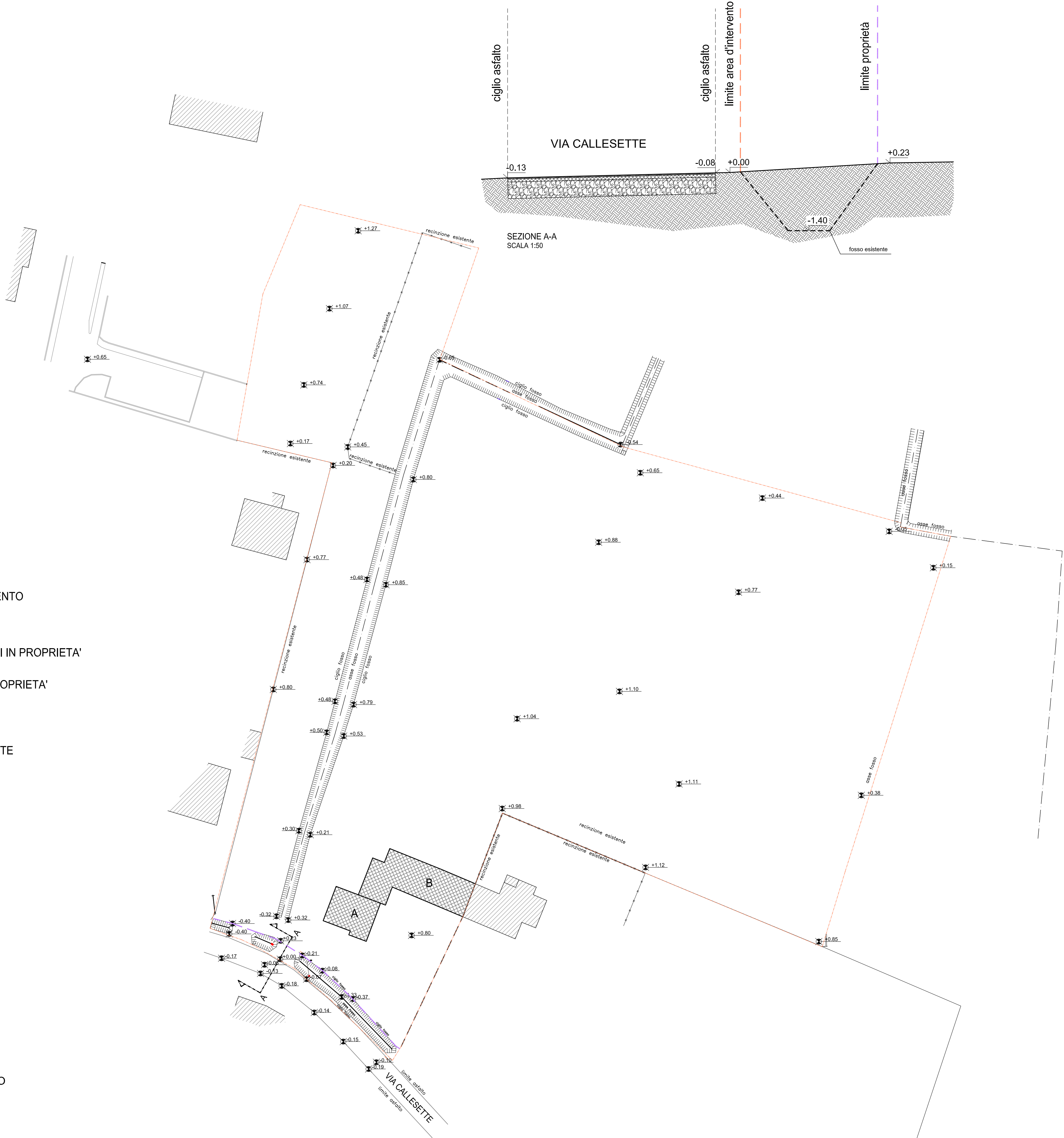
PLANIMETRIA GENERALE - STATO DI FATTO SCALA 1:500