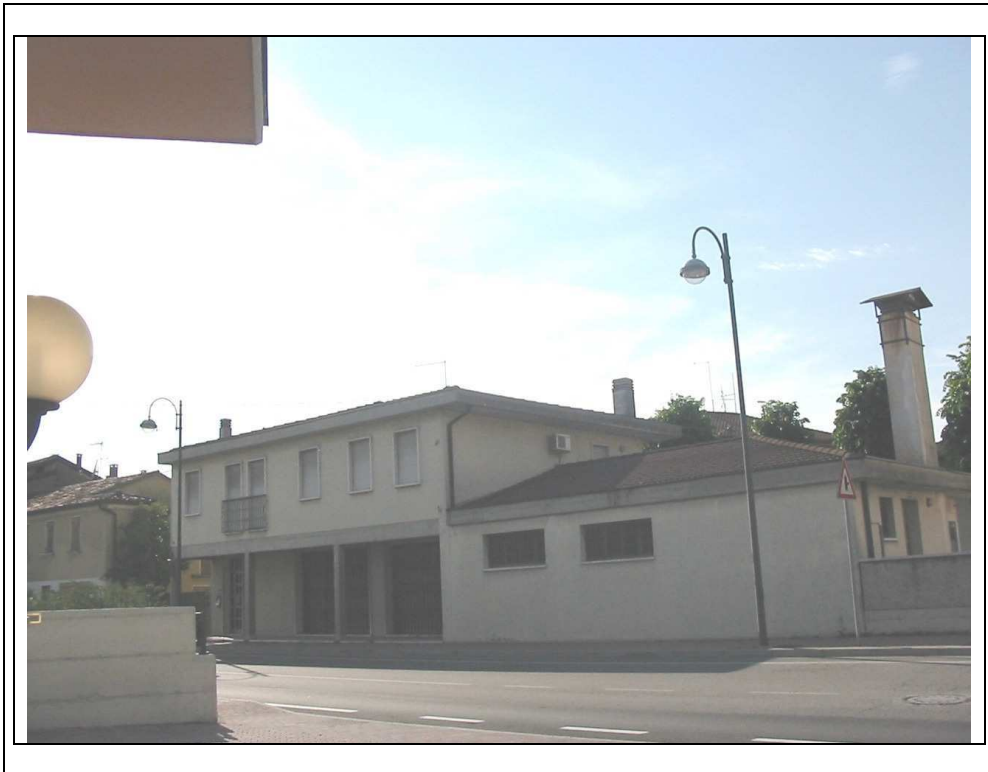
FOTO N.1 Facciata sud