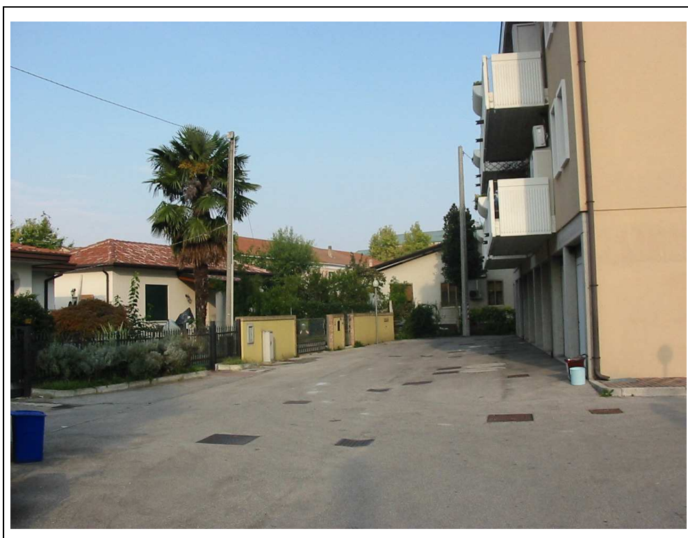
FOTO N.4 Strada pubblica vicolo delle Rose