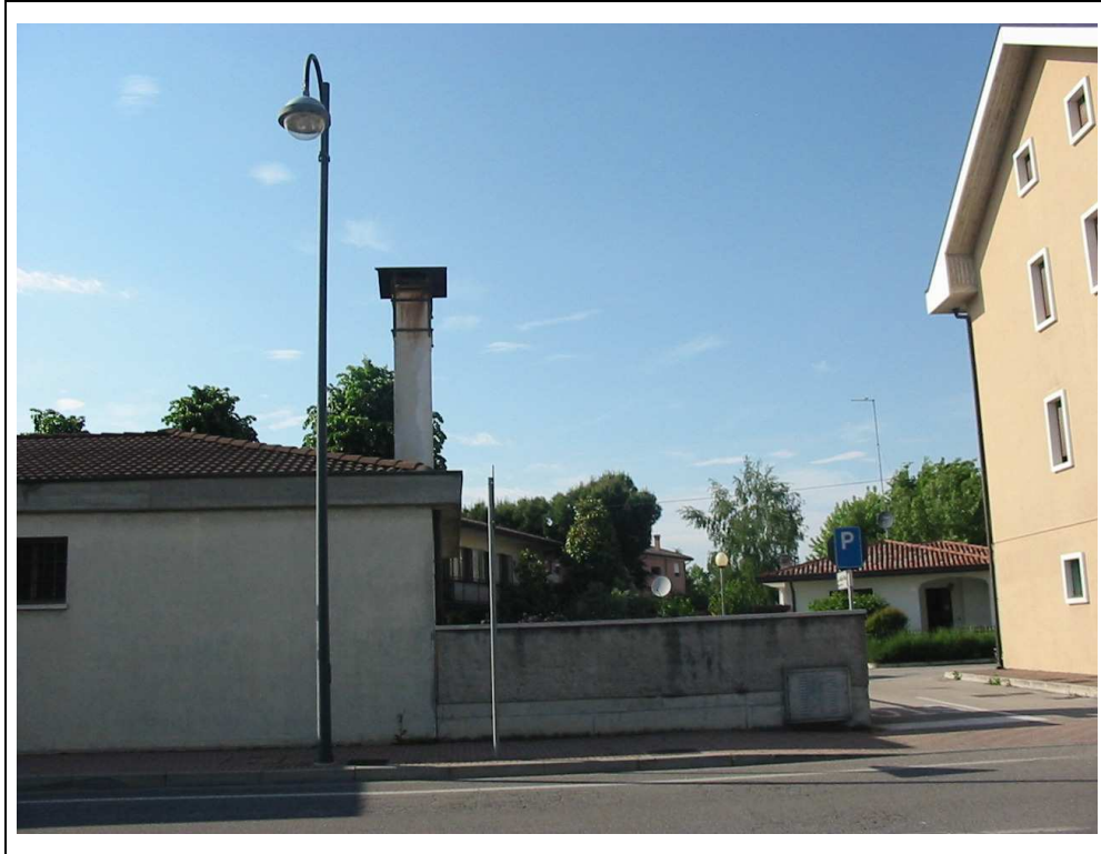
FOTO N.5 Particolare ingresso vicolo delle Rose.