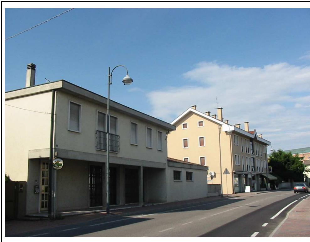
FOTO N.2 Facciata sud-ovest