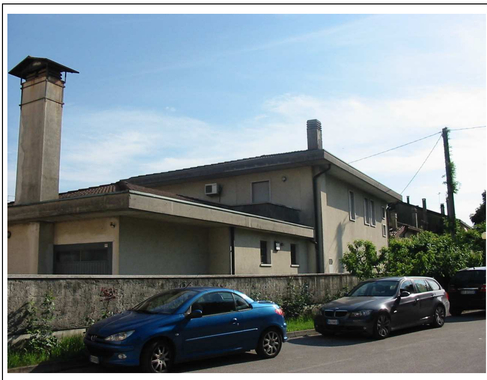
FOTO N.3 Facciata nord