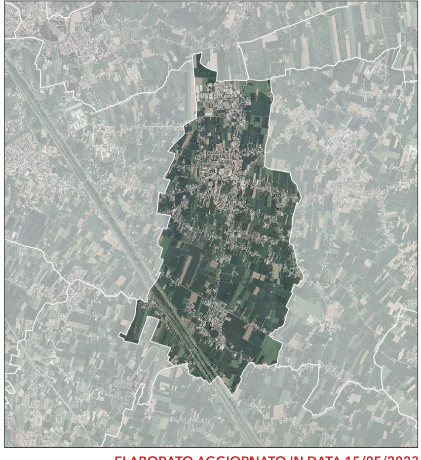
ELABORATO AGGIORNATO IN DATA 15/05/2023