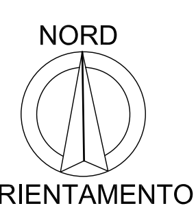
PLANIMETRO PERE SISTEMAZIONI FRONTE VIA CALLESETTE E CONFINE NORD SCALA 1:500