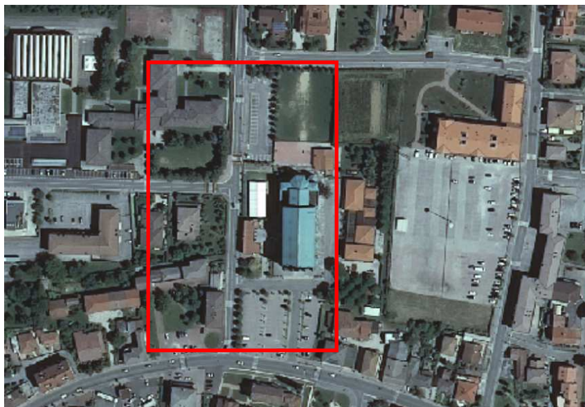
Tavola 1. Sito della manifestazione